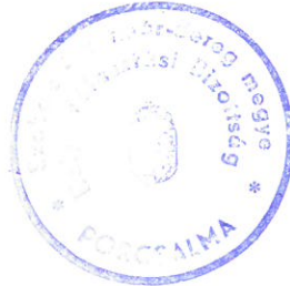
Erdős Zsigmond Helyi Választási Bizottság Elnöke